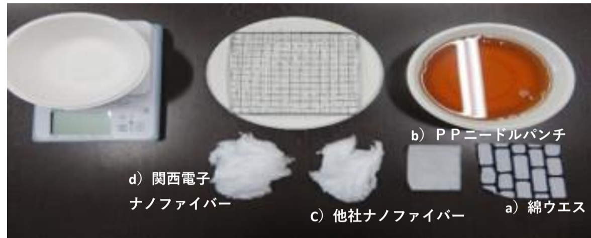
それぞれを1gに計測した写真 <計測記録写真>